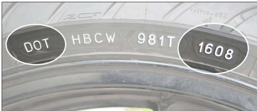
Bild 5: Die DOT-Nummer enthält viele verschlüsselte Daten, das Herstellungsdatum ergibt sich aus den letzten vier Stellen.

Die DOT-Nummer ist eine ursprünglich für den US-amerikanischen Markt vorgesehene, spezifische Kennzeichnung des Reifens, in der die unterschiedlichsten Informationen verschlüsselt sind.