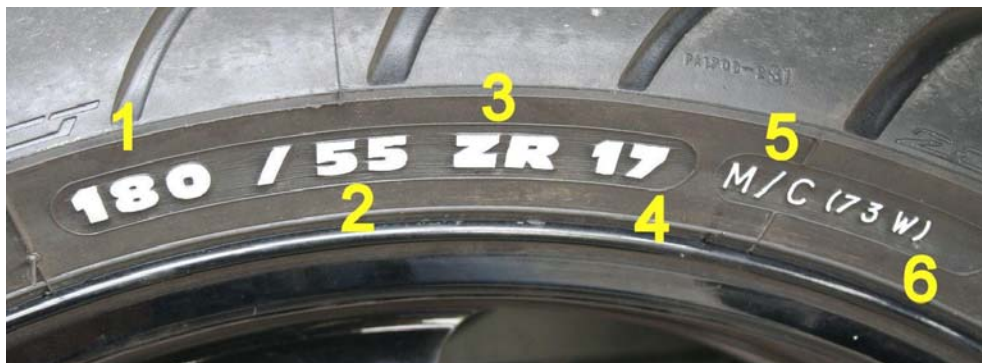
Bild 1: „Neue“ Kennzeichnung von Motorradreifen entsprechend der ECE R 75 (gültig seit 1998)