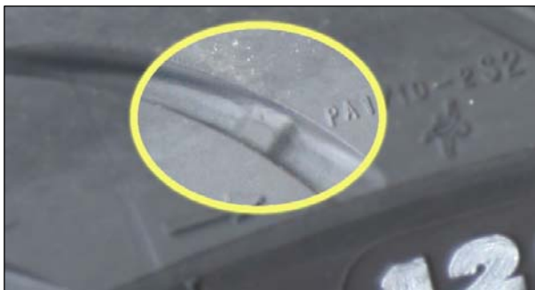
Bild 4: Der Verschleißzustand des Reifens lässt sich an dem sogenannten „Treadwear Indicator“ (TWI) erkennen.

Über den Reifenumfang verteilt sind an sechs Stellen kleine Stege im Profilgrund angebracht. Diese Stege werden auch Verschleißanzeiger oder „Treadwear-Indicator“ genannt und mit TWI angekürzt. Zum leichteren Auffinden dieser relativ unauffälligen TWI werden an der Reifenflanke oder am